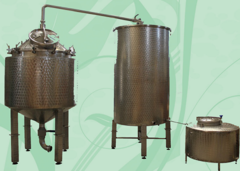
Άμβυκας απόσταξης από 1100 έως 4.000 lt. Κατασκευασμένος από INOX 316L με Μανδύα κατάλληλος για υδροαπόσταξη.