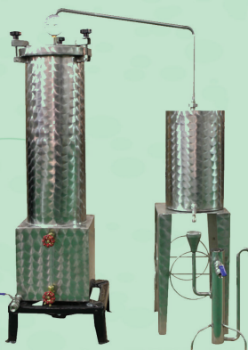
Άμβυκας απόσταξης 100 lt. Κατασκευασμένος από INOX 316L. Δυνατότητα απόσταξης βοτάνων 10 κιλών. Απόσταξη νερό με ατμό μεγαλύτερης απόδοσης.