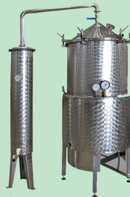
Άμβυκας απόσταξης 500 lt. Κατασκευασμένος από INOX 316L.

Μερικοί από τους συνεργάτες μας, στον τομέα της απόσταξης αιθέριων ελαίων