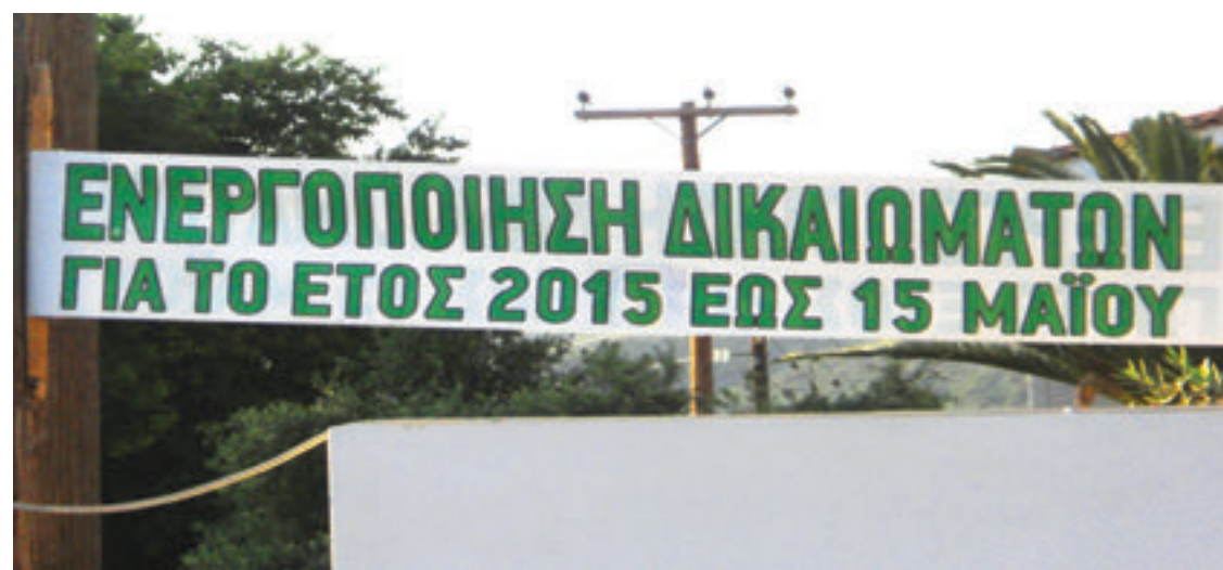
Η διαδικτυακή αίτηση γίνεται απευθείας από τον παραγωγό στον ΟΠΕΚΕΠΕ, ενώ η αίτηση μέσω των Φορέων περνά πρώτα από τον Α', τον Β', τη Γαΐα Επιχειρείν και στο τέλος καταλήγει στον Οργανισμό.

Ο φάκελος υποψηφιστότητας θα πρέπει να περιλαμβάνει κατά τον τελικό έλεγχο τις εμπονηματικές εξουσιοδοτήσεις από τους παραγωγούς.