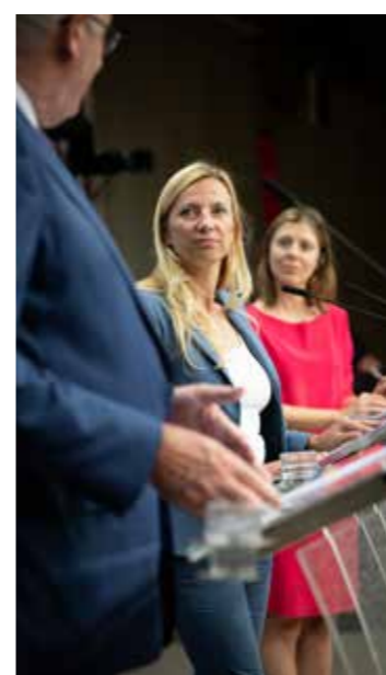
Οι απαντήσεις του Χόγκαν, πάντα έχουν διπλωματική χροιά.

Από την άλλη πλευρά, θα είναι πολύ απλούστερη για τους αγρότες, των οποίων η μόνη μέριμνα θα είναι να προστοιμάσουν το επιχειρηματικό τους σχέδιο κατά τρόπο που να εγγυάται τη μακροπρόθεσμη βιωσιμότητα της εκμετάλλευσής τους, σε αντίθεση με τη συμμόρφωση σε κριτήρια που δεν ανταποκρίνονται στις ανάγκες τους.