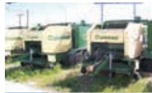
KRONE COMPI PACK

Ενσιροδιανομέας FARESIN 9 κυβικών, ΚΥΡΙΑΚΟΥ Α.Ε. Τηλ. 2310753031