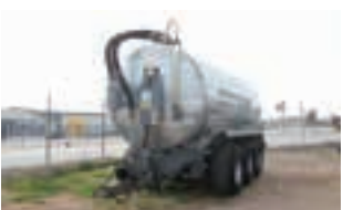
ΒΥΤΙΟ ΛΥΜΑΤΩΝ VAIA

Συρόμενο χορτοκοπτικό POTTINGER, πλάτος κοπής 3,00μ., ΚΥΡΙΑΚΟΥ Α.Ε. Τηλ. 2310753031