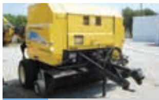
NEW HOLLAND BR6090

Μεταχειρισμένο τρακτέρ LANDINI GLOBUS 75 , έτος 2001, 73 hp, 5.090 ώρες, Παύλος Ι. Κοντέλλης Α.Ε.Β.Ε. τηλ: 210 3408817