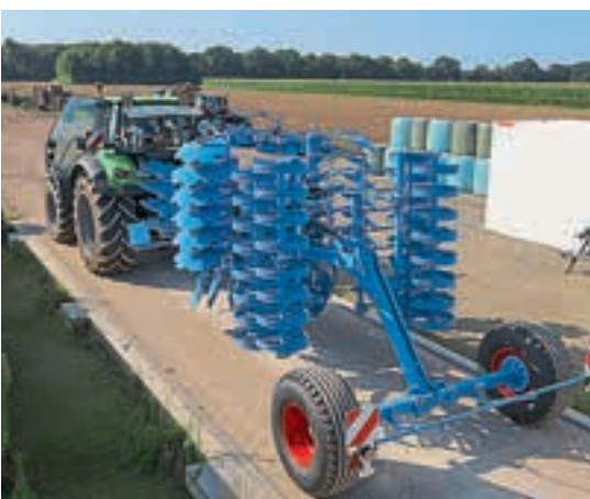
Τα βάρη καταγράφηκαν σε βαθμονομημένη γέφυρα ζύγισης.

Deutz-Fahr 6215. Το φορτίο της ράβδου έλξης μετρήθηκε στους 2,4 τόνους με τον καλιεργητή στη θέση μεταφοράς. Το φορτίο στον μπροστινό άξονα ήταν 4,8 τόνοι, που ισοδυναμεί με 32%. Όσον αφορά το πλάτος και το ύψος μεταφοράς, και τα τρία μοντέλα έχουν ύψος μικρότερο από 4 μέτρα και πλάτος μικρότερο από 3 μέτρα, αλλά διαφέρουν ως προς το μήκος.