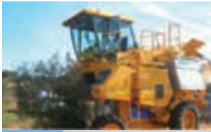
GREGOIRE G 140 SW

Το Profi, πιστό στη δέσμευσή του για προσφορά μιας ολοκληρωμένης εικόνας της αγοράς αγροτικών μηχανημάτων, ανανεώνει κάθε μήνα την ειδική στήλη για τα μεταχειρισμένα μηχανήματα, όπου ιδιώτες και εταιρείες διευκολύνουν τον υποψήφιο αγοραστή μεταχειρισμένου στην αναζήτηση του κατάλληλου εξοπλισμού