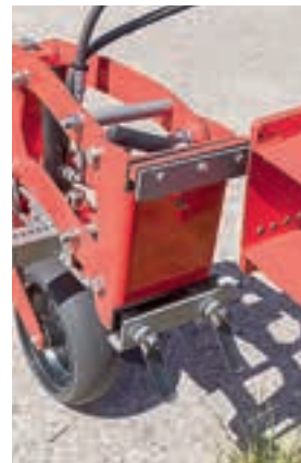
Οι πλάκες θα μπορούσαν να εξασφαλίσουν μια σταθερή, ασφαλή προσάρτηση.