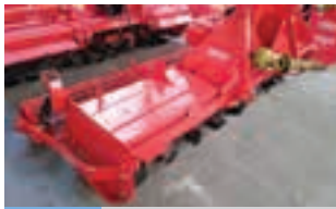
KRONE '00 2,80M

Θεριζοαλωνιστική μηχανή NEW HOLLAND TX36 . Με 7.8 lt κινήτρα 240 ίππων. 5.000 ώρες λειτουργίας στον κινήτρα. Με σταθερό μαχαίρι σίτου 5.2 μέτρα. Γ. ΧΙΓΚΑΣ Α.Β.Ε.Ε. Τηλ. 2310 780 866-9