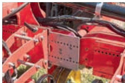
Η πλάκα μπορεί να χρειαστεί ρύθμιση, για να ταιριάζει με το μετατρόχιο του τρακτέρ.