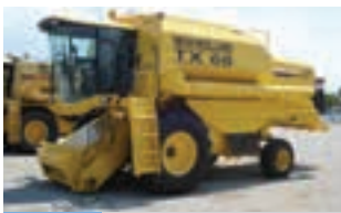
NEW HOLLAND TX 66

Μεταχειρισμένο τρακτέρ DEUTZ AGROPLUS 95 2WD, έτος 2004, 94 hp, 5.859 ώρες, Παύλος Ι. Κοντέλλης Α.Ε.Β.Ε. τηλ: 210 3408817