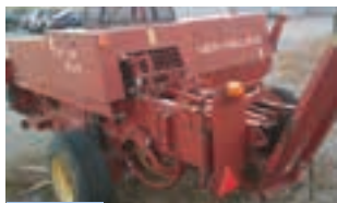
ΠΡΕΣΑ New Holland 570

HURLIMANN XT 910.6, 105HP, Μοντέλο 2003, Α&Φ ΙΩΑΝΝΙΔΗΣ Α.Ε. Τηλ. 2461021000