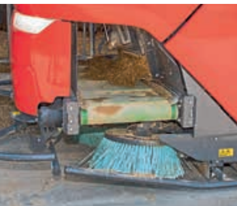
Ο μεταφορέας πίσω είναι κατάλληλος για περσάσματα τροφοδοσίας με αδιέξοδο.