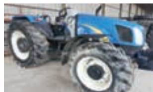
NEW HOLLAND - T5050

Χορτοδετική πρέσα τετραγώνου δέματος New Holland 570, Δετικό με σύρμα- 2004. ΑΔΕΛΦΟΙ ΣΑΡΑΚΑΚΗ Α.Ε.Β.Μ.Ε. 2103483300.