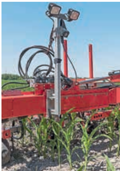
Η κάμερα, από την Tillet and Hague, αλλάζει θέση χωρίς τη χρήση εργαλείων.

Τρεις κλειδαριές (μία στο επάνω μέρος, δύο στο κάτω μέρος) συγκρατούν το στέλεχος στη γραμμή εργαλείων, εμποδίζοντας τις μονάδες της σειράς να κινούνται προς τα πλάγια. Έδειχναν να ανταποκρίνονται στο καθήκον τους, κάνοντας τις μονάδες σταθερές. Αλλά μακροπρόθεσμα, αυτή η ρύθμιση μπορεί να χρειάζεται περισσότερη προσοχή συντήρησης από μια άκαμπτη σύνδεση, πα-