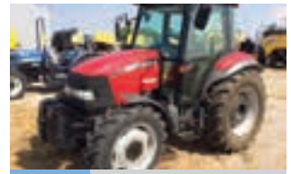
CASE JX 70

Μεταχειρισμένο τρακτέρ VALMET 8150, έτος 1997, 125 hp, 5.734 ώρες, Παύλος Ι. Κοντέλλης Α.Ε.Β.Ε. τηλ: 2310 779072