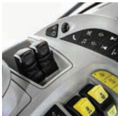
Οι διακόπτες και τα χειριστήρια είναι εύκολα προσβάσιμοι στον χειριστή.

Το νέο μοντέλο διαθέτει μια αναβαθμισμένη έκδοση του δημοφιλούς κιβωτίου ταχυτήτων Auto Command της New Holland, και βελτιωμένη μετάδοσης κίνησης καλύτερη έλξη, η οποία προσθέτει περαιτέρω στην