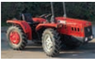
ANTONIO CARRARO TIGRONE 3700

Βυτίο λυμάτων μάρκας VENDRAME τύπου 14 m3 με πύραυλο, σε άριστη κατάσταση. ΑΦΟΙ Χ. ΓΙΑΝΝΑΚΟΥΛΑ Ο.Ε Τηλ. 2310 796807