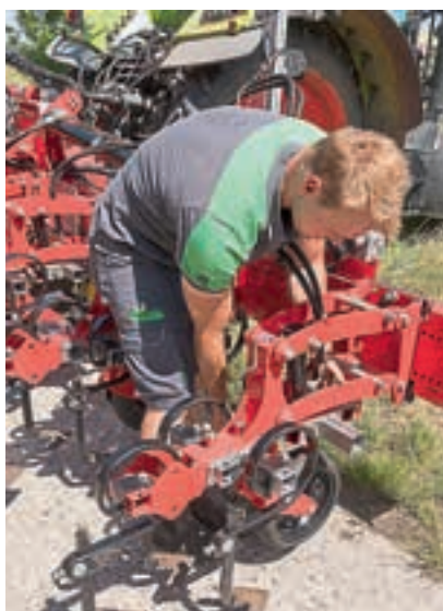
Οι μονάδες σειρών μπορούν να μετακινηθούν στο πλαίσιο για να ταιριάζουν με διαφορετικά συστήματα σποράς.