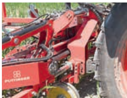
Ο καλλιεργητής Flexcare διαθέτει πλαίσιο πλευρικής μετατόπισης στάνταρ.