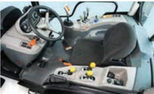
Το κιβώτιο ταχυτήτων ελέγχεται εύκολα από τον χειριστή με ένα joystick.