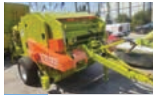
WOLAGRI COLUMBIA R10

Παλιέται φρέζα βαρέου τύπου Krone με πλάτος εργασίας 2,80μ και κύλινδρο με ανέμη. Σε εξαιρετική κατάσταση με καινούρια μαχαίρια. Γ. ΧΙΓΚΑΣ Α.Β.Ε.Ε. Τηλ. 2310 780 866-9