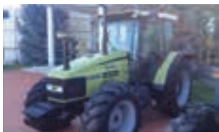
HURLIMANN XT 910.6

HURLIMANN XT 910.6, 105HP, Μοντέλο 2003, Α&Φ ΙΩΑΝΝΙΔΗΣ Α.Ε. Τηλ. 2461021000