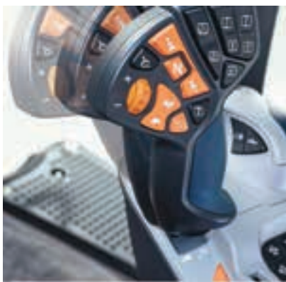
Γκάτζι, υδραυλικά, αυτόματα διεύθυνση και άλλες λειτουργίες στο νέο SideWinder Ultra.

μα με ηλεκτρικά μεταβαλλόμενες γεωμετρίας τούρμπο, εξασφαλίζει υψηλή ροπή και απόδοση καυσίμου στις χαμηλές στροφές. Το τρακτέρ πληροί τα πρότυπα εκπομπών Stage V με σύστημα μετεπεξεργασίας High e-SCR, που βελτιστοποιεί την ισχύ, την απόκριση και την οικονομία καυσίμου. Οι πελάτες θα μπορούν να περνούν περισσότερο χρόνο στα χωράφια, με αύξηση 18% στη χωρητικότητα καυσίμου, και να ελαχιστοποιούν το λειτουργικό τους κόστος με ένα διάστημα σέρβις που είναι 50% μεγαλύτερο από ορισμένους ανταγωνιστές», σημειώνει η εταιρεία.