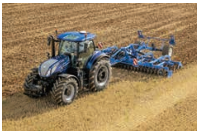
Τα ελαστικά ύψους 2,05 μέτρων αυξάνουν την πρόσφυση.

ζοντας την επικοινωνία προς και από το μηχάνημα. Το νέο μοντέλο διαθέτει επίσης βραβευμένες τεχνολογίες αυτοματισμού, οι οποίες θα προσφέρουν απτά οφέλη για τους πελάτες: το ενσωματωμένο σύστημα ελέγχου μεγάλης τετράγωνης χορτοδετικής, που βελτιστοποιεί την αλληλεπίδραση μεταξύ του τρακτέρ και του χορτοδετικού, προβλέ-