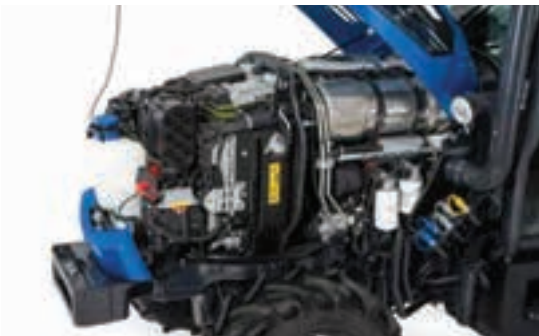
Η νέα γενιά κινητήρων της Deutz, 4 κυλίνδρων, 16 βαλβίδων, 2,9 λίτρων.