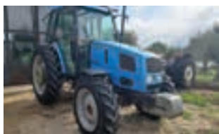
LANDINI GLOBUS 75

Μεταχειρισμένο τρακτέρ LANDINI GLOBUS 75 , έτος 2001, 73 hp, 5.090 ώρες, Παύλος Ι. Κοντέλλης Α.Ε.Β.Ε. τηλ: 210 3408817