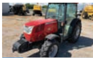
MC CORMICK F80

Μεταχειρισμένη πρέσα στρογγυλή NEW HOLLAND BR6090, έτος 2011, Παύλος Ι. Κοντέλλης