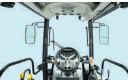
Δυνατότητα επιλογής καμπίνας με ανάρτηση και αναρτώμενο άξονα εμπρός.

να συνδυαστεί με σύστημα hands-free και τηλεμετρίας.