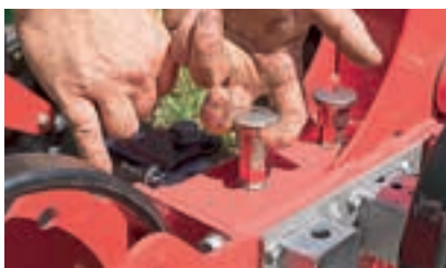
Το πλάτος εργασίας μπορεί να ρυθμιστεί χωρίς την ανάγκη εργαλείων.

Κάθε μία από αυτές τις βάσεις για δόντια μπορεί να επανατοποθετηθεί λοξά σε βήματα των 15 χλστ. ή να αφαιρεθεί ή να μετακινηθεί. Οι πλαϊνές πλάκες καθοδήγησης στις βάσεις εργαλείων διασφαλίζουν την καλή εφαρμογή. Τα δόντια αποτελούνται από ένα ελατήριο τύπου Triple K με ξεχωριστό κάθετα ρυθμιζόμενο πόδι, στο οποίο το στέλεχος βιδώνει στη συνέχεια.