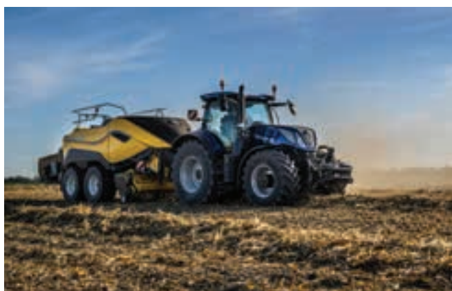
Το τρακτέρ πληροί τα πρότυπα εκπομπών Stage V με σύστημα μετεπεξεργασίας High e-SCR, που βελτιστοποιεί την ισχύ.