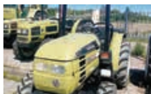
HURLIMANN H-435 DT

HURLIMANN H 709 XN: 90HP, Μοντέλο 2004 Α&Φ ΙΩΑΝΝΙΔΗΣ Α.Ε. Τηλ. 24610-21000