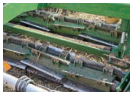
Η διπλή μονάδα στη μέση μπορεί επίσης να φιλοξενήσει δίσκους σε σχήμα αστεριού ή κυματιστούς, ακόμη και κυλίνδρους μαχαιριών.