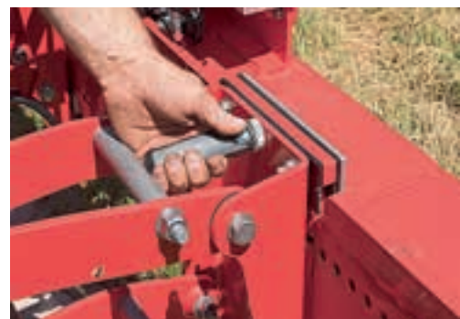
Τρεις μοχλοί πρέπει να αφαιρεθούν σε κάθε μονάδα σειράς για να μετακινηθούν.