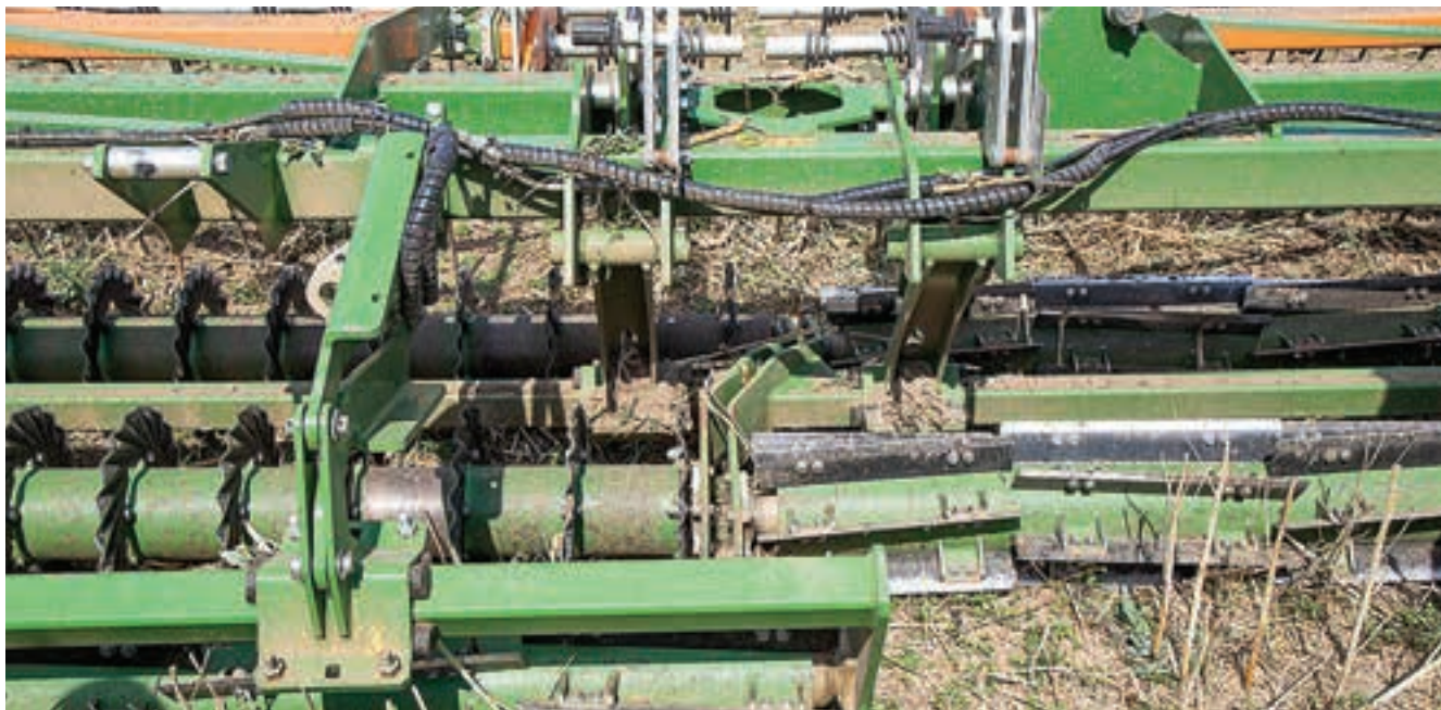
Τα άκρα των διαφόρων στοιχείων είναι αντισταθμισμένα μεταξύ τους.