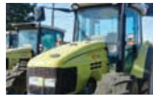
HURLIMANN XT 105

HURLIMANN H-435 DT (35hp) Μοντέλο 2001 Α & Φ ΙΩΑΝΝΙΔΗΣ Α.Ε. Τηλ. 2461021000-2.