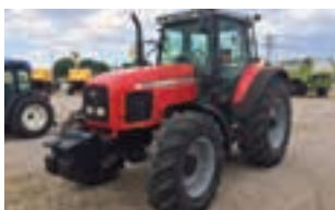
MASSEY FERGUSON 8220

Μεταχειρισμένη Θεριζοαλωνιστική NEW HOLLAND TX 66, έτος 1995, 266 hp, 3.540 ώρες, Παύλος Ι. Κοντέλλης Α.Ε.Β.Ε. τηλ: 2310 779072