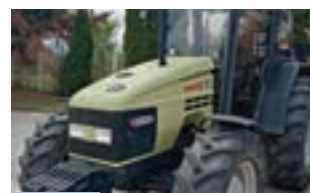
HURLIMANN PRESTIGE 75

HURLIMANN XB 95 TB (96hp) Μοντέλο 2011 Α & Φ ΙΩΑΝΝΙΔΗΣ Α.Ε. Τηλ. 2461021000-2.