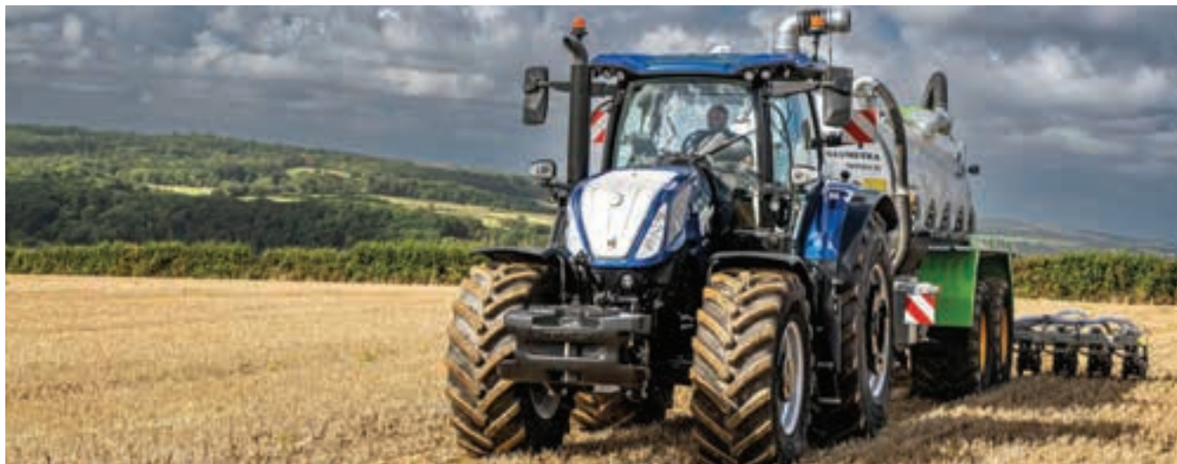
Το νέο T7.300 LWB αποδίδει μέγιστη ισχύ 280 ίππους για βαριές εργασίες και 300 ίππους για εργασίες PTO και μεταφοράς.