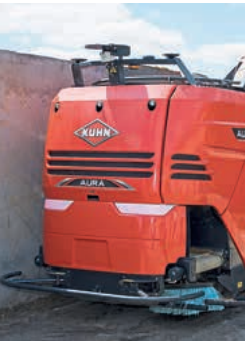
Προφυλακτήρες, ραντάρ, Lidar, αισθητήρες υπερήχων και δύο κεραίες GNSS με σήμα GPS RTK, για πλοήγηση και αποφυγή σύγκρουσης.