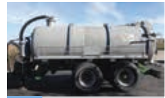
ΒΥΤΙΟ ΛΥΜΑΤΩΝ VENDRAME

Πλατφόρμα συλλογής χόρτου Deutz Fahr K 7.27 Με pick up 1,6 μέτρων, με ταπέτο μεταφοράς Όγκος φορτίου 18 κυβ. (27 κυβ. συμπιεσμένο). Γ. ΧΙΓΚΑΣ Α.Β.Ε.Ε. Τηλ. 2310 780 866-9