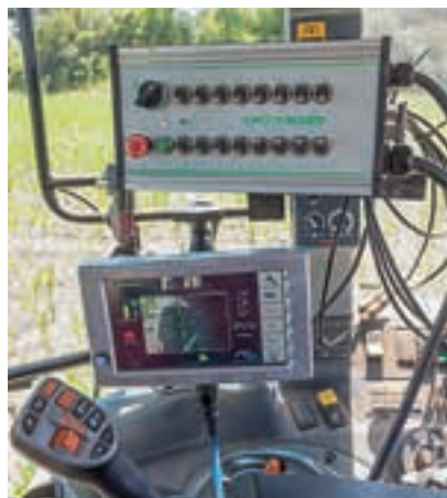
Η τεχνολογία έλεγχου τμημάτων αναπτύσσεται από την εταιρεία.

Τα πόδια είναι 30x10 χλστ., με ράβδο κατά μήκος της πλάτης για να ρυθμίζεται το ύψος. Υπάρχει δυνατότητα επιλογής ποδιών 16 ή 18 εκατοστών και λεπίδων πλάτους 16 ή 18 εκατοστών, ανάλογα με τη συγκεκριμένη εφαρμογή εκείνη τη στιγμή.