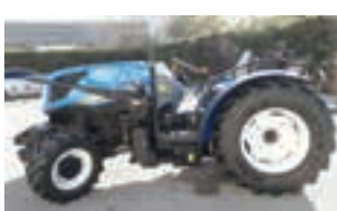
NEW HOLLAND T4.80F