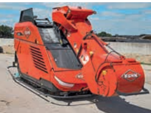
Ο βραχίονας φόρτωσης στηρίζεται στο μπράνιο και μπορεί να κινηθεί έως και 70 εκ.

λεπτά. Σήμερα, αφιερώνονται 30 λεπτά για να αποκαλύψουν τους χώρους ενσίρωσης, να κόψουν τα κομμάτια από τον τοίχο και να γεμίσουν την αποθήκη χονδροειδών ζωοτροφών που βρίσκεται σε ένα μικρό σιλό.