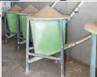
Τα οροκτά κ.λπ. προστίθενται με κοχλίες.

Ενώ το Aura μπορεί να εντοπίσει ένα εμπόδιο στο πέρασμά του, δεν μπορεί (ακόμα) να το προσπεράσει. Αντίθετα, το μηχάνημα σταματά και περιμένει, αλλά αν το εμπόδιο δεν κινηθεί γρήγορα, το μηχάνημα σταματά και στέλνει στον αγρότη ένα μήνυμα. Ομοίως, αποστέλλεται ένα μήνυμα εάν ένα άτομο πλησιάσει πολύ όταν γεμίζει τον σφιγκτήρα ή στέκεται πάνω από το λάκκο. Η ανίχνευση