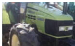
HURLIMANN XT 908

Τρακτέρ HURLIMANN PRESTIGE 75 ΜΟΝΤΕΛΟ 2010, 75HP, Α&Φ ΙΩΑΝΝΙΔΗΣ Α.Ε. Τηλ. 2461021000