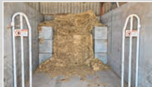
Η χύδην χονδροειδής ύλη πρέπει να αποθηκεύεται σε ύψος 1,80 μ. και βάθος 2 μ..

Πριν από την άφιξη του Aura, η σίτιση γινόταν μία φορά την ημέρα και χρειάζονταν 90