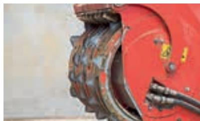
Ο προφυλακτήρας και το μαχαίρι βγαίνει όταν το μηχανήμα φτάνει στο σκάμμα.