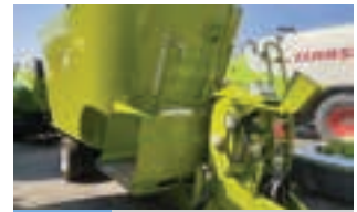
STORTI DUNKER T2.180

Πρέσσα σταθερού θαλάμου wolagri columbia R10 πλήρως ελεγχμένη και έτοιμη για δουλειά. Γ. ΧΙΓΚΑΣ Α.Β.Ε.Ε. Τηλ. 2310 780 866-9