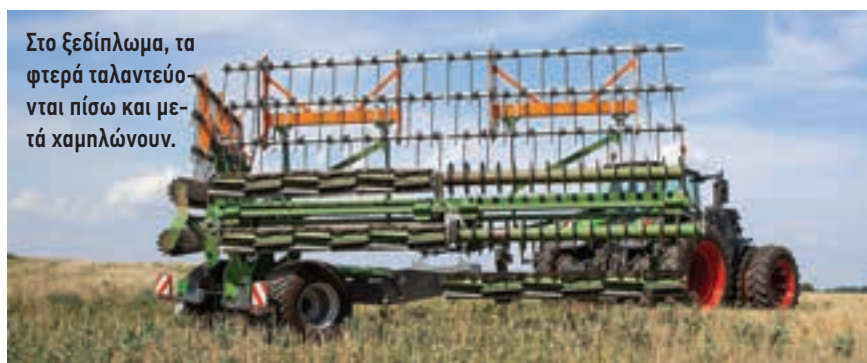
Στο ξεδίπλωμα, τα φτερά ταλαντεύονται πίσω και μετά χαμηλώνουν.

κληρο τον άξονα και στη συνέχεια να εργαστείτε για να φτάσετε στον κατεστραμμένο δίσκο από κάθε άκρο του άξονα. Δεν υπάρχει μεμονωμένος έλεγχος βάθους για κάθε δίσκο, όπως με το Catros, αλλά αυτό δεν ήταν ιδιαίτερο ζήτημα κατά τη διάρκεια της δοκιμής. Ο απλός σχεδιασμός, με λιγότερα ρουλεμάν, είναι σίγουρα ένα σημαντικό