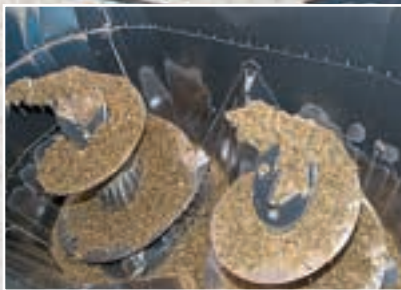
Το κάτω μέρος του κάδου των 3,0 m 3 έχει επένδυση από ανοξείδωτο χάλυβα.