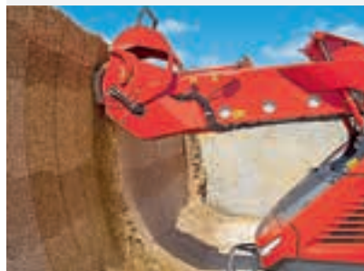
Το βάθος κοπής είναι 8-10 εκ. Οι αισθητήρες δεν προσδιορίζουν το σκάμμα εμπρός.