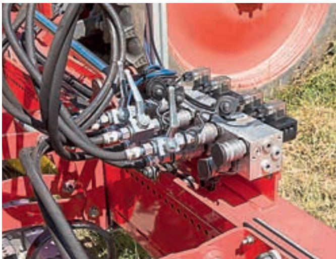
Υπάρχουν ταχυ- σύνδεσμοι για τους υδραυλικούς σω- λήνες εμβόλων.

ρά το γεγονός ότι οι έκκεντροι σφικκτήρες είναι ρυθμιζόμενοι.