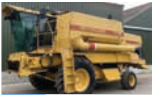
NEW HOLLAND '94 TX 36

Θεριζοαλωνιστική Deutz-Fahr 6 - αλογη σε άριστη κατάσταση με σταθερό μαχαίρι σίτου. Γ. ΧΙΓΚΑΣ Α.Β.Ε.Ε. Τηλ. 2310 780 866-9