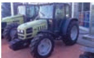
HURLIMANN XA 76

Τηλεσκοπικοί φορτωτές Dieci, Merlo 100 ίππων με μέγιστη ανώψωση 7μ. Κυριακού Α.Ε. Τηλ. 2310753031.