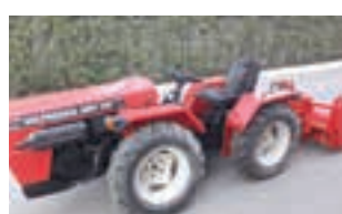
VALPADANA 4RM 300

New Holland T4.80F, 4WD, 75 HP, Μοντέλο 2021 και μόνο με 197 ώρες ΠΑΝΑΓΙΩΤΗΣ ΚΑΤΣΑΡΟΣ Α.Ε.Τ.Β.Ε. 2310723793.