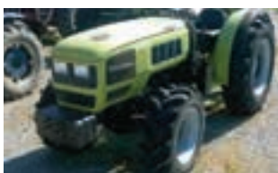
HURLIMANN H 709 XN

HURLIMANN XT 908, 85 HP, Μοντέλο 2000, Α & Φ ΙΩΑΝΝΙΔΗΣ Α.Ε. Τηλ. 2461021000