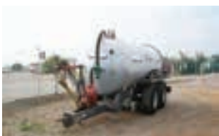
ΒΥΤΙΟ ΛΥΜΑΤΩΝ AMOS

Χορτοδοτική πρέσα Krone Vario 1500 μεταβλητού θαλάμου και Συρόμενο χορτοκοπτικό Krone 3210 CRI. Κυριακού Α.Ε. Τηλ. 2310753031.