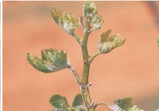
Νεαροί βλαστοί με έντονη προσβολή από ωίδιο ( Uncinula necator )