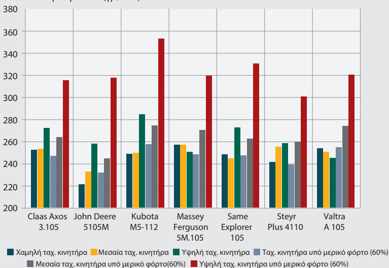
Κατανάλωση πετρελαίου (γρ./kwh)

Το John Deere 5105M είναι το πιο λιτό μηχανήμα υπό πλήρη φόρτο, με το Steyr Plus 4110 να ακολουθεί. Παύτως, συστήνεται να αποφεύγουν υψηλές ταχύτητες κινητήρα όταν πραγματοποιούνται εφαρμογές υπό μισό φόρτο.