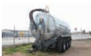
ΒΥΤΙΟ ΛΥΜΑΤΩΝ VAIA

Χορτοδετική πρέσα Krone Vario 1500 μεταβλητού θαλάμου και Συρόμενο χορτοκοπτικό Krone 3210 CRI. Κυριακού Α.Ε. Τηλ. 2310753031.