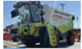
CLAAS LEXION 520

Άροτρο 3υπο αναστρεφόμενο, έτος 1996, 4.000 ευρώ. Γ.Ι. Αντωνάκης Α.Ε., Τηλ. 2262025915.