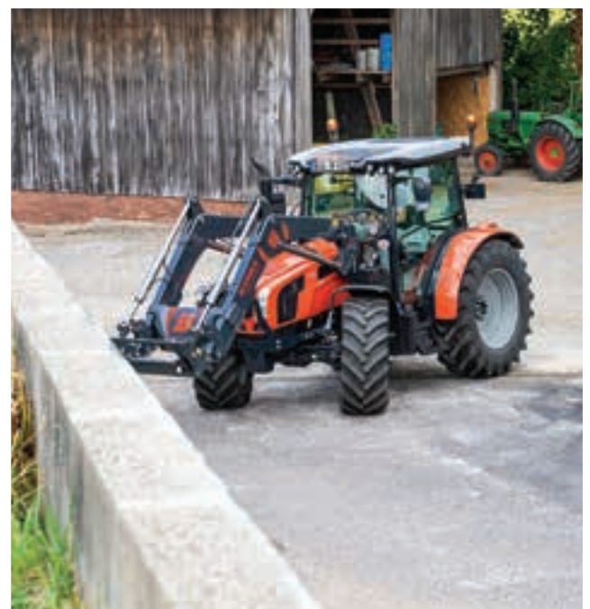
...ενώ το SAME Explorer 105, είναι πιο σταθραό.