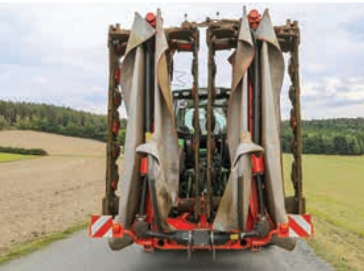
Στο δρόμο, το GMD διπλώνεται σε ένα πακέτο κάτω από 3.0 μέτρα.