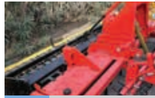
MASCHIO DRAGO '98

John deere 4755, μοντέλο 1991, 6κύλινδρο στα 190 άλογα σε πολύ καλή κατάσταση έτοιμη για δουλειά! Γ. ΧΙΓΚΑΣ Α.Ε.Ε. Τηλ: 2310780866-9