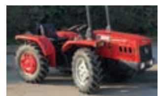
ANTONIO CARRARO TIGRONE 3700

Βυτίο λυμάτων μάρκας VENDRAME τύπου 14 m 3 με πύραυλο, σε άριστη κατάσταση. ΑΦΟΙ Χ. ΓΙΑΝΝΑΚΟΥΛΑ Ο.Ε Τηλ. 2310 796807