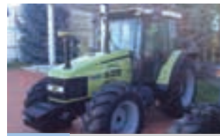
HURLIMANN XT 910.6

HURLIMANN XT 105, 100 HP, Μοντέλο 2006, Α&Φ ΙΩΑΝΝΙΔΗΣ Α.Ε. Τηλ.: 2461021000