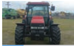
MTX CASE IH JX 95

Valpadana 4RM 300, 30 HP, Μοντέλο 1997 και 1600 ώρες. ΠΑΝΑΓΙΩΤΗΣ ΚΑΤΣΑΡΟΣ Α.Ε.Τ.Β.Ε. 2310723793.