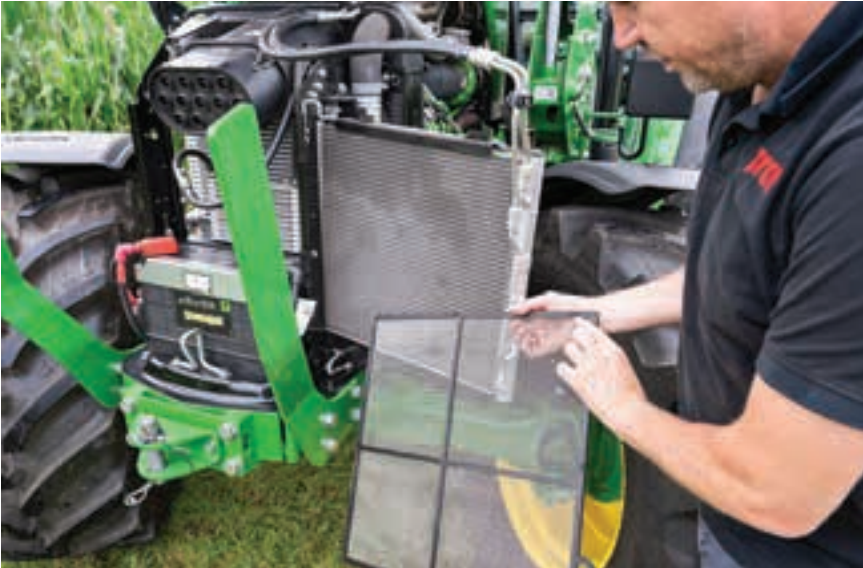
Εύκολη πρόσβαση για συντήρηση των ψυκτικών μονάδων του τρακτέρ John Deere.

αντιλαμβάνεται κανείς δεν είναι η ισχύς όλων 100hp βάσει του αρχικού σκοπού της δοκιμής, αλλά αυτό συμβαίνει γιατί δεν ταιριάζουν ιδανικά όλα τα μοντέλα. Για παράδειγμα, τα πιο ελαφριά Steyr Plus παρά το πλεονέκτημα ισχύος είναι πιο ευκίνητα από τα Claas Axos. Η μέγιστη ισχύς των pto για το Steyr και το John Deere είναι 71,7 kW/97,5 hp - αυτό είναι περίπου το 88% της αναφερόμενης ισχύος.