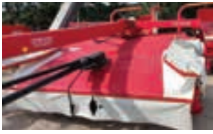
ANTONIO CARRARO TIGRONE 3700

Χορτοδετική πρέσα WELGER 630, τετράγωνο δέματος με σχοινί. Γ. ΧΙΓΚΑΣ Α.Ε.Ε. Τηλ: 2310780866-9