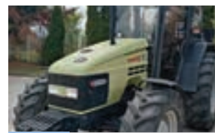
HURLIMANN PRESTIGE 75

HURLIMANN XB 95 TB (96hp) Μοντέλο 2011 Α & Φ ΙΩΑΝΝΙΔΗΣ Α.Ε. Τηλ. 2461021000-2.