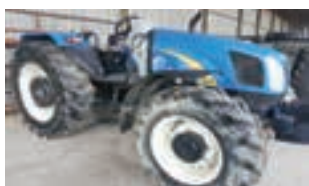
NEW HOLLAND - T5050

Χορτοβετική πρέσα τετράγωνου δέματος New Holland 570, Δετικό με σύρμα- 2004. ΑΔΕΛΦΟΙ ΣΑΡΑΚΑΚΗ Α.Ε.Β.Μ.Ε. 2103483300.