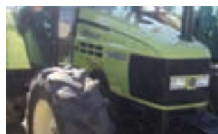
HURLIMANN XT 908

Εναεροδιανομείς Luclar Ιταλίας οριζόντιοι με 2 κοχλίες από 5-12 κυβ. Κυριακού Α.Ε. Τηλ. 2310753031.