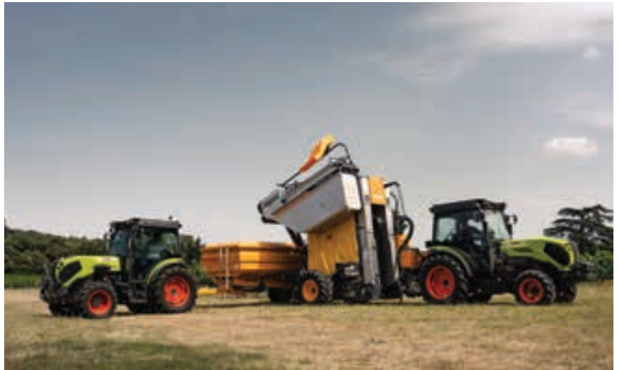
Το μικρό πλάτος μόλις 1-1,55 μέτρων επιτρέπει στα τέσσερα μοντέλα της καινούργιας σειράς να κινούνται με άνεση μεταξύ των σειρών των αμπελώνων και στους οπωρώνες

Χάρη στη διαρκώς μεταβαλλόμενη μετάδοση CMATIC τα νέα Nexos 2 μπορούν να κιν-