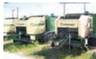
KRONE COMPI PACK

Εναεροδιανομέας FARESIN 9 κυβικών, ΚΥΡΙΑΚΟΥ Α.Ε. Τηλ. 2310753031