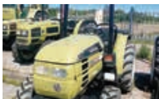
HURLIMANN H-435 DT

HURLIMANN H 709 XN: 90HP, Μοντέλο 2004 Α&Φ ΙΩΑΝΝΙΔΗΣ Α.Ε. Τηλ. 24610-21000