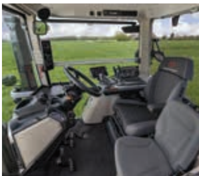
Οι δοκιμές Powermix αξιολογούν την απόδοση ελκυστήρων σε πολλές συνθήκες.

56,88 λίτ/ώ για το MF 8S.265 Xtra Dyna E-Power, όταν οι βασικοί ανταγωνιστές ξεπερνούσαν τα 62 λίτ/ώ στην ονομαστική ισχύ ISO, οδηγώντας σε εξοικονόμηση καυσίμου μέχρι και 5.150 λίτρα ανά 1.000 ώρες λειτουργίας του ελκυστήρα.