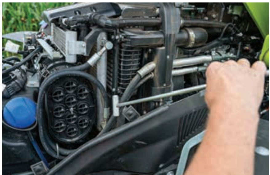
Λίγο πιο δύσκολη η πρόσβαση στο Claas Axos, αλλά και πάλι ικανοποιητική.

Παρόλο που και τα επτά μοντέλα αναπτύσσουν ταχύτητα 40 χλμ./ώρα σε χαμηλές στρο-