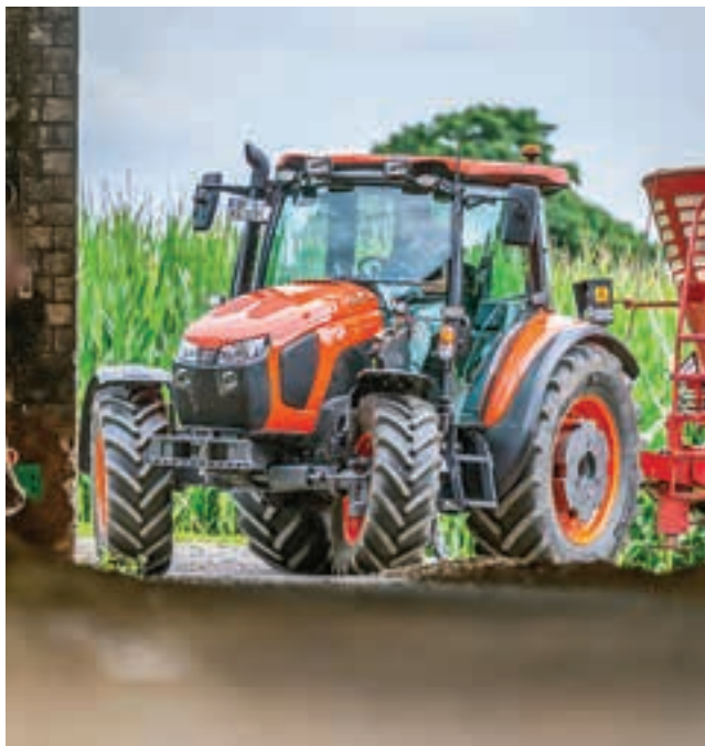
Το Kubota M5-112 είναι το πιο ευέλικτο μηχανήμα της δοκιμής...

Πέρα από τα συστήματα ελέγχου για τη λειτουργία του μπροστινού φορτωτή, υπάρχουν παραδοσιακά καλώδια Bowden για τη λειτουργία των πίσω κοτσαδόρων. Μόνο το