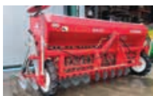
NEW HOLLAND T4.80F

Συρόμενο χορτοκοπτικό LELY 370, μοντέλο 2012, με σιδερένιο συνθλιπτικό. Γ. ΧΙΓΚΑΣ Α.Ε.Ε. Τηλ: 2310780866-9