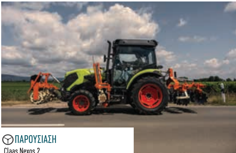
ΠΑΡΟΥΣΙΑΣΗ Claas Nexos 2