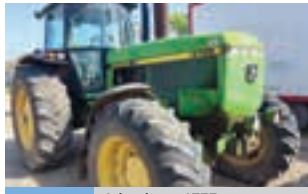
John deere 4755

Πλήρως ανακατασκευασμένες πνευματικές σπαστικές μηχανές GASPARDO MT600 με δίσκα, 4 σειρών με διανομείς φαρμάκου και λιπάσματος σε υπερ-άριστη κατάσταση. Γ. ΧΙΓΚΑΣ Α.Ε.Ε. Τηλ: 2310780866-9