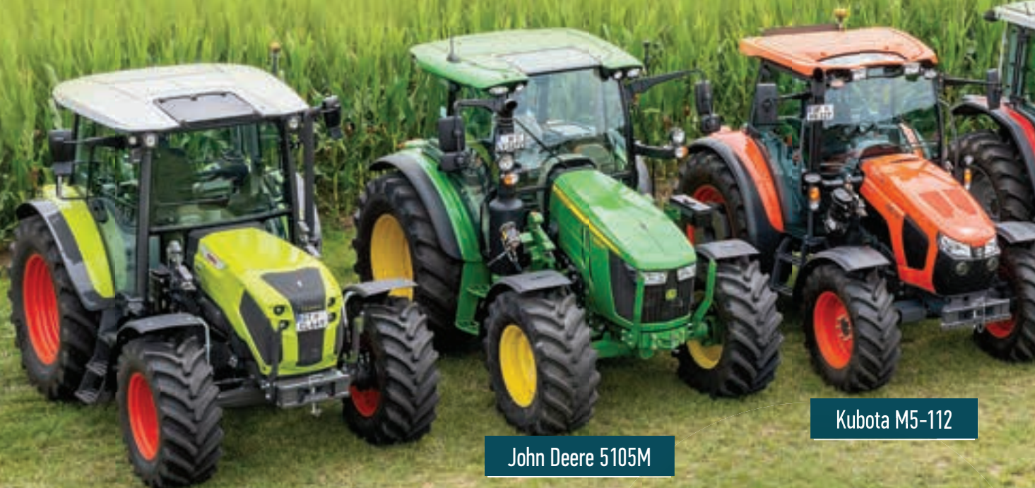
Claas Axos 3.105

Και τα επτά μοντέλα διαθέτουν τετρακύλινδρους κινητήρες κυβισμού από 3,6 λίτρα (Claas, CNH) έως 4,5 λίτρα (John Deere) και πληρούν όλες τις προδιαγραφές Stage V, χρησιμοποιώντας διάφορες μεθόδους επεξεργασίας καυσαερίων. Όλα διαθέτουν ακόμα AdBlue.