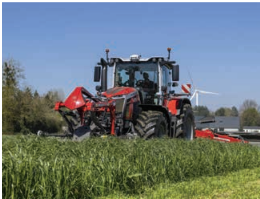
Το MF 8S.Xtra Dyna F-Power πέτυχαν εξαιρετικά αποτελέσματα στις αγροτικές εργασίες πετυχώντας την πρώτη θέση συνολικά στην κατηγορία ισχύος μέχρι και 330 ίππου.