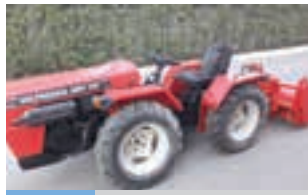
VALPADANA 4RM 300

New Holland T4.80F, 4WD, 75 HP, Μοντέλο 2021 και μόνο με 197 ώρες. ΠΑΝΑΓΙΩΤΗΣ ΚΑΤΣΑΡΟΣ Α.Ε.Τ.Β.Ε. 2310723793.