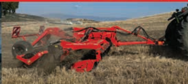
DiscoPlus RT 500 RB 7 HD