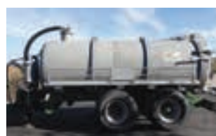
ΒΥΤΙΟ ΛΥΜΑΤΩΝ VENDRAME

Πλήρως ανακατασκευασμένη αυτοσπαστική FERABOLI serie E-2, χωρητικότητα σε σπόρο 500 L, 3 M πλάτος εργασίας. Γ. ΧΙΓΚΑΣ Α.Ε.Ε. Τηλ: 2310780866-9