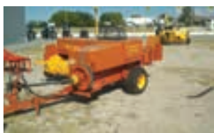
ΧΟΡΤΟΔΕΤΙΚΗ ΠΡΕΣΑ 575

Θεριζοαλωνιστική Μηχανή NEW HOLLAND CX 8080 SL, 2WD, 6.500 ώρες, μοντέλο 2010, στοιχεία επικοινωνίας ΠΑΥΛΟΣ Ι. ΚΟΝΤΕΛΛΗΣ Α.Ε.Β.Ε. 2310779072 ή 2103408923.