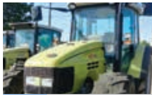
HURLIMANN XT 105

HURLIMANN H-435 DT (35hp) Μοντέλο 2001 Α & Φ ΙΩΑΝΝΙΔΗΣ Α.Ε. Τηλ. 2461021000-2.