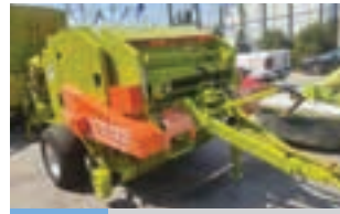
WOLAGRI COLUMBIA R10

Πλήρως ανακατασκευασμένες πνευματικές σπαστικές μηχανές GASPARDO 540 με καρίνα, 4 σειρών με διανομείς φαρμάκου και με δυνατότητα προσθήκης λιπάσματος. Γ. ΧΙΓΚΑΣ Α.Ε.Ε. Τηλ: 2310780866-9