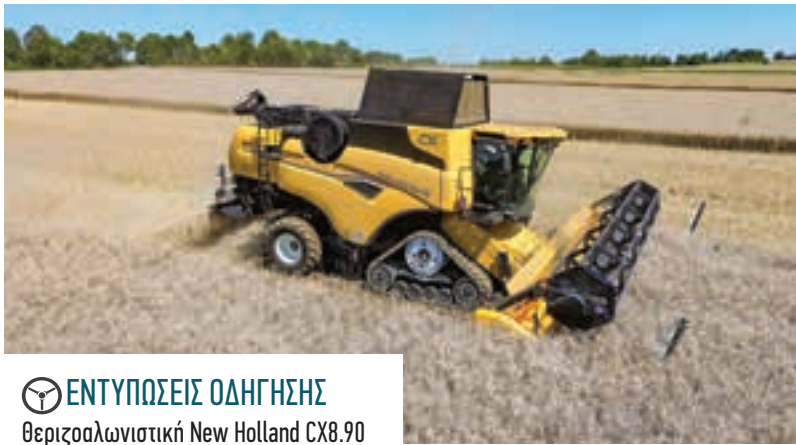
ΕΝΤΥΠΩΣΕΙΣ ΟΔΗΓΗΣΗΣ Θεριζοαλωνιστική New Holland CX8.90