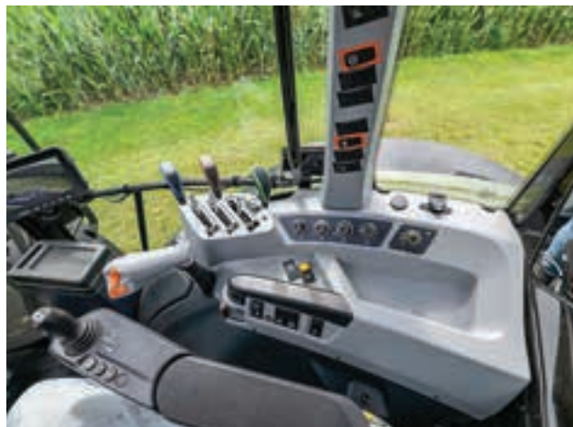
Το Valtra είναι πολύ βολικό για αλλαγή ταχυτήτων.

SAME έχει ηλεκτρική βαλβίδα (άσπρη/μαύρη) για ένα πιθανό υδραυλικό πάνω σύνδεσμο. Τα καλώδια Bowden στο Valtra και το Kubota είναι τα πιο εύκολα στη χρήση. Αυτό ισχύει τόσο για τη διαρρύθμιση όσο και τη διαμόρφωση. Στο Claas Axos, παρατηρήσαμε ότι οι βαλβίδες δεν σταματούν πάντα στη μεσαία θέση. Δεν έχουν όλοι οι κοτσαδόροι ελεύθερη θέση.