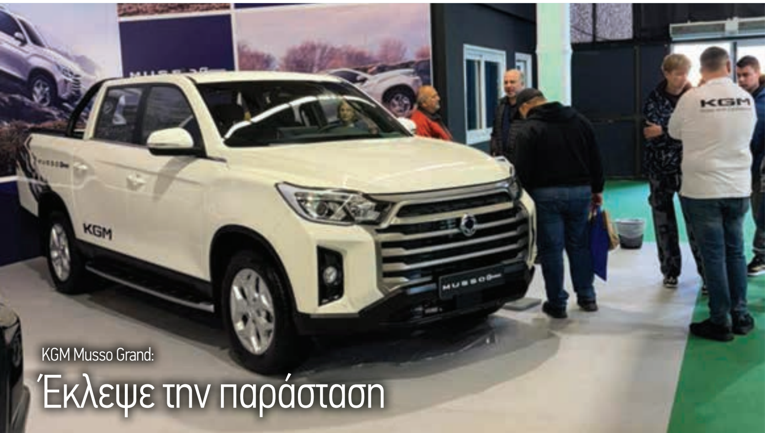
KGM Musso Grand: