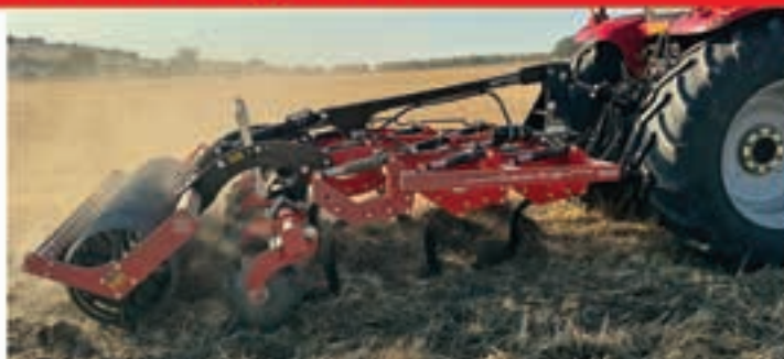
Dracon M HD 300 Master HD 300