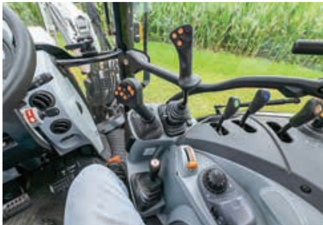
Το MultiController του Steyr είναι σε άβολη θέση, αλλά αλλαγή κατεύθυνσης μπορεί να γίνει και στο χειριστήριο του φορτωτή.