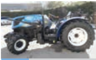
NEW HOLLAND T4.80F