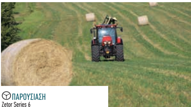
ΠΑΡΟΥΣΙΑΣΗ Zetor Series 6

38 ΕΝΤΥΠΩΣΕΙΣ ΟΔΗΓΗΣΗΣ: Θεριζοαλωνιστική New Holland CX8.90 Η τελευταία γενιά θεριζοαλωνιστικών της New Holland CX8, αποκαλύπτεται στο profi.