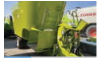
STORTI DUNKER T2.180

Πρέσα σταθερού θαλάμου wolagri columbia R10 πλήρως ελεγχμένη και έτοιμη για δουλειά. Γ. ΧΙΓΚΑΣ Α.Ε.Ε. Τηλ. 2310 780 866-9