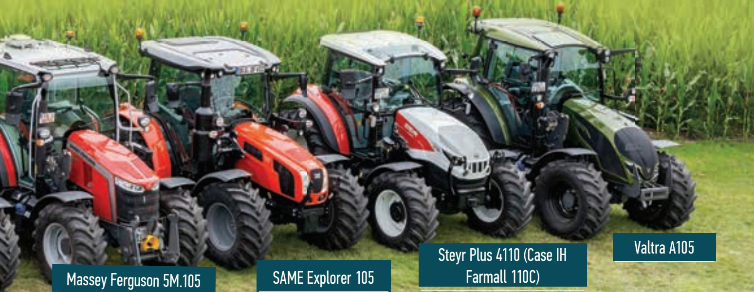
Massey Ferguson 5M.105

Έχοντας υπόψιν τις προδιαγραφές των κατασκευαστών, η ονομαστική ισχύς των Claas Axos είναι 110 hp, του Steyr Plus 110 hp και των Kubota M5 είναι 114 hp. Όπως