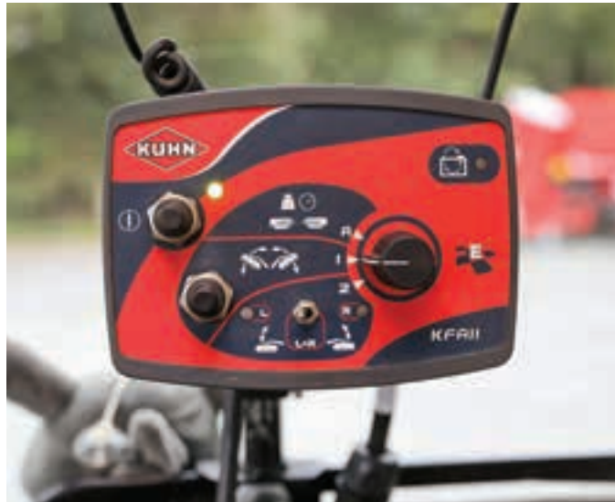
Το απλό κιβώτιο ελέγχου λειτουργεί το μηχάνημα 14.5 μέτρων.