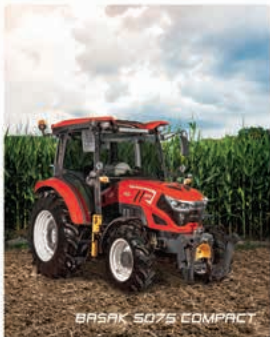
BASAK 5075 COMPACT