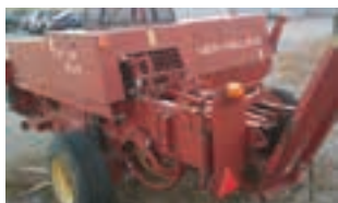
ΠΡΕΣΑ New Holland 570

Χορτοβετική πρέσα τετράγωνου δέματος New Holland 570, Δετικό με σύρμα- 2004. ΑΔΕΛΦΟΙ ΣΑΡΑΚΑΚΗ Α.Ε.Β.Μ.Ε. 2103483300.