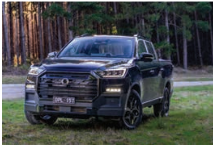
Το Musso Grand ξεχώρισε στην Αγροτικά για την πρακτικότητα, τον μεγάλο χώρο φόρτωσης και την ευρύχωρη καμπίνα του.

Ξεχωριστή παρουσία στην 31η Διεθνή Έκθεση Αγροτικά (12-15 Μαρτίου) αποτέλεσε το κορυφαίο pick-up της KGM, Musso Grand, που φέρνει στη χώρα μας η Νικ. Ι. Θεοχαράκης. Κατά τη διάρκεια της έκθεσης, το KGM Musso Grand προσέλκυσε το έντονο ενδιαφέρον των επισκεπτών, οι οποίοι είχαν την ευκαιρία να το δουν από κοντά, να γνωρίσουν τα χαρακτηριστικά του και να ανακαλύψουν τις δυνατότητές του ως ένα σύγχρονο, στιβαρό και ικανό pick-up, σχεδιασμένο να ανταποκρίνεται με επιτυχία τόσο στις επαγγελματικές όσο και στις καθημερινές απαιτήσεις. Η παρουσία του στην Αγροτικά επιβεβαίωσε ότι το KGM Musso Grand αποτελεί ιδανική επιλογή για την ελληνική αγορά, καθώς ξεχώρισε με την πρακτικότητα, τον μεγάλο χώρο φόρτωσης και την εξαιρετικά ευρύχωρη καμπίνα επιβατών, αποδεικνύοντας ότι αποτελεί την πιο ολοκληρωμένη πρόταση της κατηγορίας του. Στην «καρδιά» του βρίσκεται ένας τετρακύλινδρος πετρελαιοκινητήρας e-XDi220 2,2 λίτρων που προσφέρει ισχύ 202 ίππων και ροπή 444 Nm. Ο ενισχυμένος δομικός σχεδιασμός βελτιώνει τη στρεπτική ακαμψία κατά την