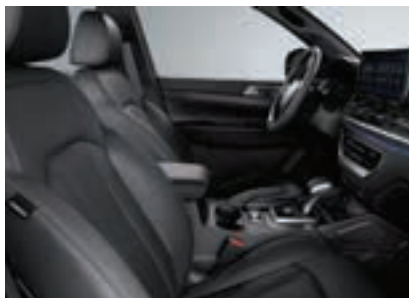
Η ασφαλής καμπίνα διαθέτει συστήματα νέας τεχνολογίας και έχει έξι αερόσακους.

οδήγηση, αυξάνει τη μέση εφελκυστική αντοχή του αμαξώματος και ενισχύει ιδιαίτερα την ασφάλεια γύρω από την καμπίνα. Τα Musso Grand διαθέτουν έξι αερόσακους. Από αυτούς οι δύο είναι εγκατεστημένοι δίπλα στον οδηγό και στον συνοδηγό, ενώ άλλοι τέσσερις βρίσκονται στα πλάγια της πρώτης σειράς καθισμάτων. Η καρότσα του Musso Grand είναι μια από τις μεγαλύτερες στην κατηγορία των διπλοκάμπινων pick-up με μήκος 1,61 μ. και πλάτος 1,57 μ..