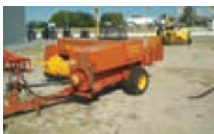
ΧΟΡΤΟΔΕΤΙΚΗ ΠΡΕΣΑ 575

Θεριζοαλωνιστική Μηχανή NEW HOLLAND CX 8080 SL, 2WD, 6.500 ώρες, μοντέλο 2010, στοιχεία επικοινωνίας ΠΑΥΛΟΣ Ι. ΚΟΝΤΕΛΛΗΣ Α.Ε.Β.Ε. 2310779072 ή 2103408923.