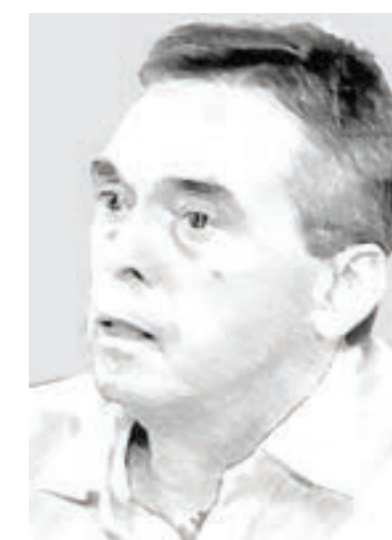
Εντατικά μαθήματα για τον πρόεδρο του ΟΠΕΚΕΠΕ, Δρ Γρηγόρη Βάρρα.

Επίσης, συζητήθηκε, ενόψει της έναρξης του έργου, το θέμα της πιστοποίησης των ΚΥΔ, καθώς και μία σειρά από επιμέρους ζητήματα που αφορούν σε τεχνικά θέματα που ά-