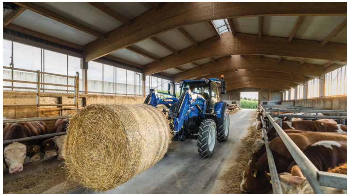
Τα 400.000 ευρώ επιλέξιμων δαπανών αφορούν επενδυτικά σχέδια των οποίων τουλάχιστον το 70% του προϋπολογισμού αφορά δαπάνες κατασκευή ή/και εκσυγχρονισμό κτηνοτροφικών κτιρίων και πάγιο εξοπλισμό που ενσωματώνεται στα ανωτέρω κτίρια.

Αμελκτικά συγκροτήματα, ταινίες μεταφοράς, σιλό αποθήκευσης ζωοτροφών, συγκροτήματα παραγωγής ζωοτροφών, συγκροτήματα θέρμανσης και δροσισμού, ταίστρες, ποτίστρες, εξοπλισμός διαχείρισης αποβλήτων της εκμετάλλευσης, αποφερωτήρες, περονοφόρα, bobcat... Μέχρι και στάβλοι κατασκευασμένοι με τη χρήση έξυπνων υλικών με βιοκλιματικά χαρακτηριστικά. Ό,τι μπορεί να έχει ανάγκη μία σύγχρονη κτηνοτροφική εκμετάλλευση, είναι σε θέση να επιδοτήσουν τα Σχέδια Βελτίωσης του 2026 για τους επαγγελματίες του χώρου που επιμένουν και έχουν κάθε διάθεση να επενδύσουν αξιοποιώντας την οριζόντια επιδότηση του 60% επί των δαπανών. Μάλιστα ο καθένας θα μπορεί, όταν ανοίξει η πρόσκληση, να κατεβάσει φάκελο έως 400.000 ευρώ.