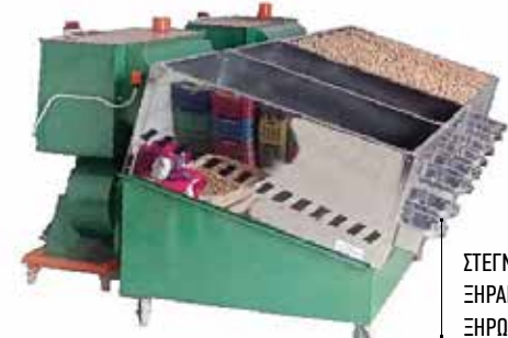
ΣΤΕΓΝΩΤΗΡΙΟ ΞΗΡΑΝΤΗΡΙΟ ΞΗΡΩΝ ΚΑΡΠΩΝ