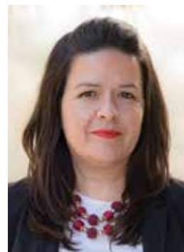
ΤΗΣ ΜΑΡΙΑΣ Γ. ΧΑΤΖΗΔΑΚΗ*

Άνοιξε για πρώτη φορά το 2017 για όλες τις Δράσεις (11.1 & 11.2). Το μόνο κριτήριο επιλεξιμότητας όμως, ήταν τα τεμάχια να βρίσκονται σε περιοχές Natura. Το δεδομένο αυτό, σε συνδυασμό με τον πολύ αυξημένο αριθμό αιτήσεων, οδήγησε για τη μεν Κτηνοτροφία στην ακύρωση του Προγράμματος, ενώ για τη Φυτική Παραγωγή που τελικά προχώρησε, στην απόρριψη πολλών αιτήσεων, με αποτέλεσμα να μείνουν εκτός προγράμματος κατηγορίες παραγωγών που δεν θα έπρεπε, όπως πχ παλιό