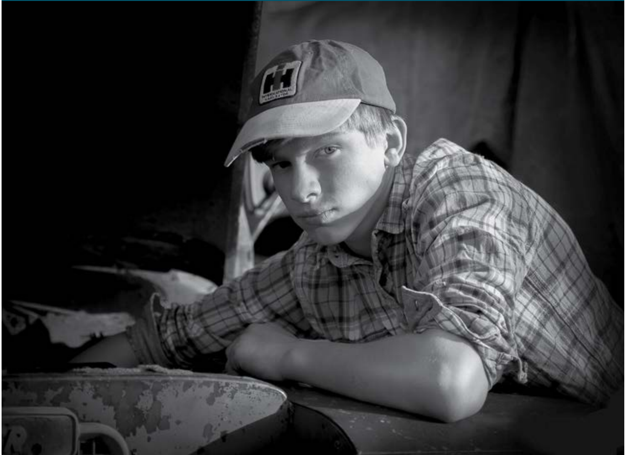
■ ΠΩΛΗΣΕΙΣ ΤΡΑΚΤΕΡ (Α' ΕΞΑΜΗΝΟ)