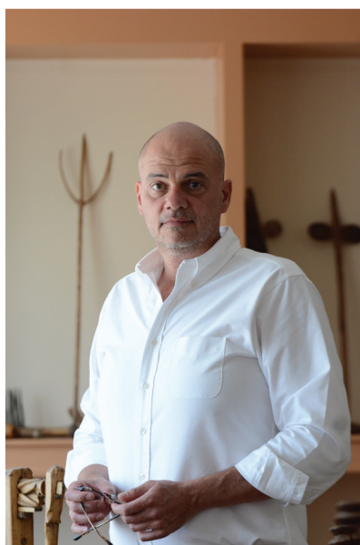
Το δυνατό σημείο της εταιρείας ήταν και είναι το δίκτυό της και οι άνθρωποί της.

Μέσα από το Εθνικό σχέδιο ανάκαμψης και ανθεκτικότητας, έχουν προϋπολογιστεί €520 εκατομμύρια για το μετασχηματισμό στον γεωργικό τομέα με προσανατολισμό την πράσινη γεωργία και την γεωργία ακριβείας. Αυτά προτάσσουν οριζόντιες και κάθετες συνεργασίες σε πρωτογενή, δευτερογενή και τριτογενή τομέα με στόχο την καινοτομία και την εξωστρέφεια. Είναι δεδομένο ότι τα χρήματα είναι πολλά και ότι μπορούν να βοηθήσουν. Μένει να διευκρινιστεί και να δούμε τον τρόπο με τον οποίο θα διατεθούν για να μεγιστοποιηθεί η απορροφητικότητα τους.