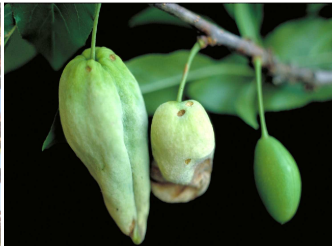
Σύμπτωμα εξώασκου σε φύλλωμα ροδακινιάς και σε καρπούς δαμασκηνιάς