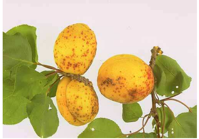
Σύμπτωμα κορύνεου σε ροδάκινα και βερίκοκα